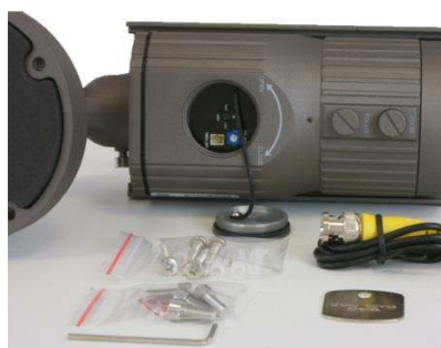
Dostęp do menu i wyjścia testowego